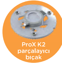
ProX K2 parçalayıcı bıçak