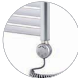
Electrical kit 2