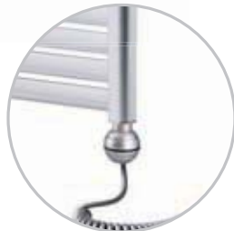
Electrical kit 1