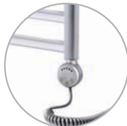
Electrical kit 2