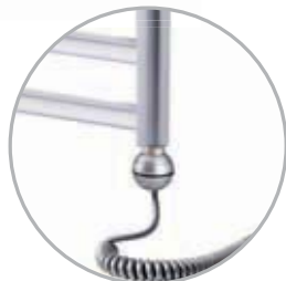
Electrical kit 1