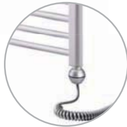
Electrical kit 1