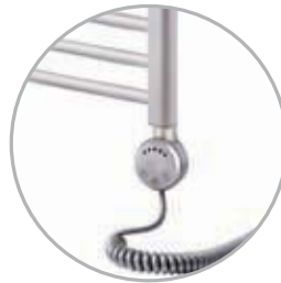
Electrical kit 2