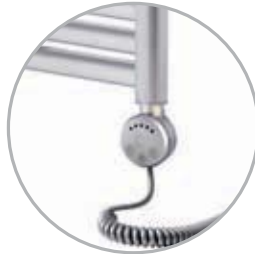
Electrical kit 2