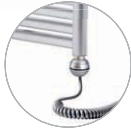
Electrical kit 1