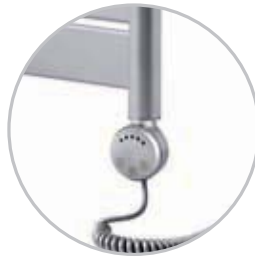
Electrical kit 2