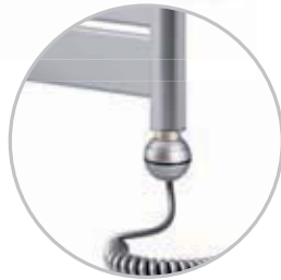
Electrical kit 1