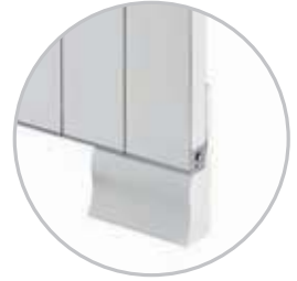
* Zemine Montaj Floor Installation