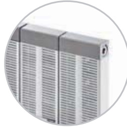
* Arka Panjur Back Side Air Duct