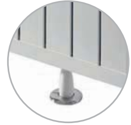
* Zemine Montaj Floor Installation