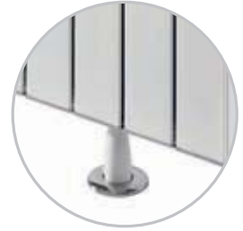
* Zemine Montaj Floor Installation